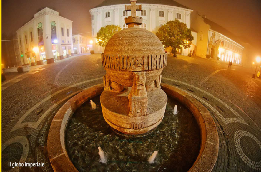
il globo imperiale

del Giardino dei Ruderì, fu costruito con le pietre dell'antica chiesa di incoronazione. I lavori hanno durato oltre vent'anni per questo sull'edificio, fondamentalmente di stile barocco, si vedono anche decorazioni di stile Luigi XVI. Al centro della Városház tér (Piazza del Municipio) si trova la scultura il globo imperiale (10) con una scritta che proclama la fierezza degli abitanti della città: "Fehérvár, città libera per grazia del re Santo Stefano".