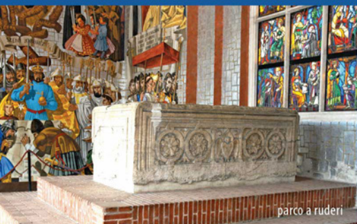
parco a ruderì

Dopo la devastazione turca Székesfehérvár vide una nuova fioritura nel Settecento e nell'Ottocento. Nel Centro Storico l'assetto stradale ha conservato la propria struttura